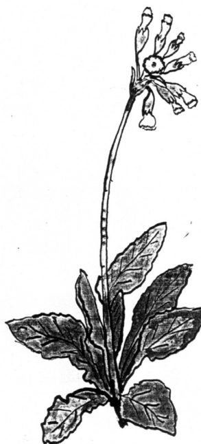
Prvosienka jarní Ondřej Vaško, žák 9. třídy